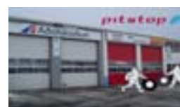
Hjallahraun 4, Hfj.