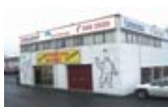
Dugguvogur 10, Rvík.