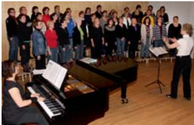
Frá æfingu kórsins á mánudaginn í Hásölum.

Tónleikar í Hásölum þriðjudaginn 28. apríl