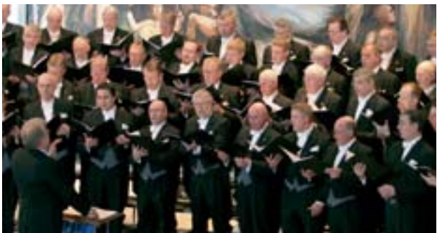
Ljós: Guðni Gíslason

Tónleikarnir voru í Grafarvogskirkju og Víðistaðakirkju um helgina en verða í Hafnirborg í kvöld, síðasta vetrardag, kl. 20 og í Nes Kirkju sumardaginn fyrsta, kl. 16.