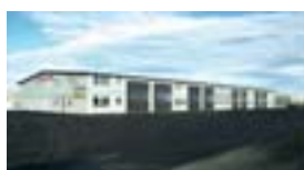
Rauðhella 11, Hfj.

Hafðu samband og við finnum réttu dekkinn fyrir þig á lægri verðum.