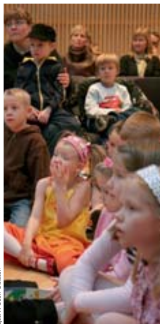
Athyglina skortir ekki hjá krökkumum í sunnudagaskólanum.

Sýnt verður í kirkjunni og eru allir velkomnir. Leikritið er sérstaklega sniðið að börnum sem eru á sunnudagaskólaaldri og börnum í fyrstu bekkjum grunnskóla. Þetta er þó leikrit sem allir hafa gaman af, burtséð frá aldri.