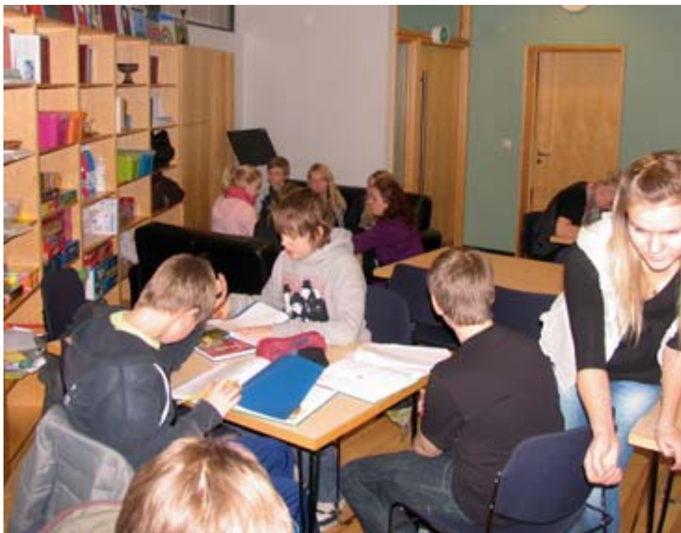
Frá fermingarnámskeiði í safnaðarheimli Hafnarfjarðarkirkju.

Dagskrá æskulýðsstarfsins má finna á auglýsingatöflu safnaðarheimilis Hafnarfjarðarkirkju og brátt á heimasíðu kirkjunnar, hafnarfjardarkirkja.is.