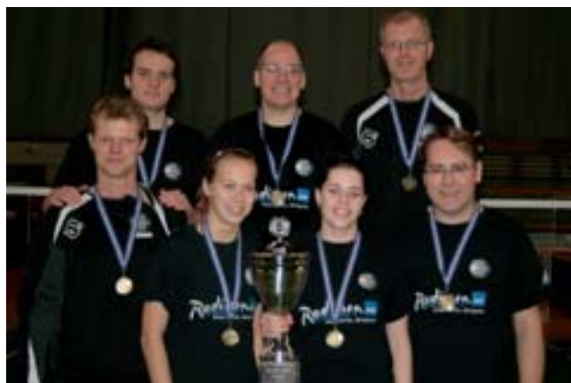
BH naglarnir sem urðu Íslandsmeistarar í B-deild í badminton.

stæðingum og létu sig ekki af hendi áreynslulaust auk þess sem nokkrir leikir unnust.