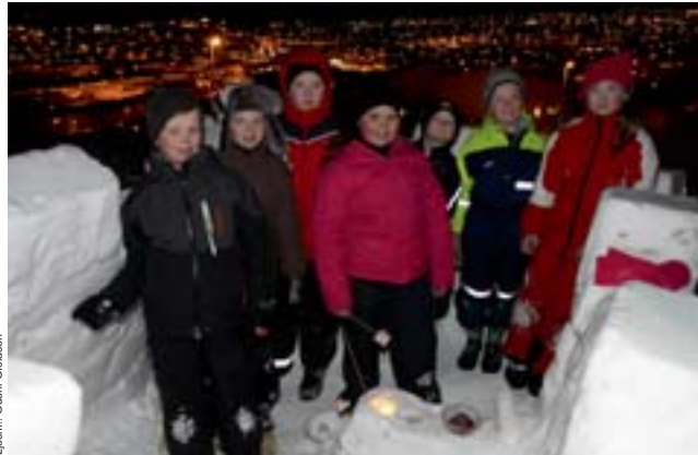
Þessi 6 m 2 snjókastali sem börnin í Klukkubergi byggðu er ekki metinn til fjár.

að það þarf að lækka verulega ef það á að jafna út hækkun síðustu ára. Rétt er að taka fram að miðað er við krónutölur samninga á hverjum tíma.