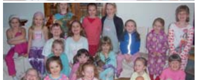
Frá náttfatapartíy kórsanna sl. föstudag.