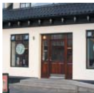
Súfistinn Strandgötu 9 Úrvals kaffi og meðlæti