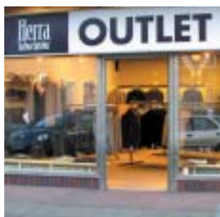
Outlet Strandgötu 11 Örlítið eldri tiskuvörur á lágmarksverði