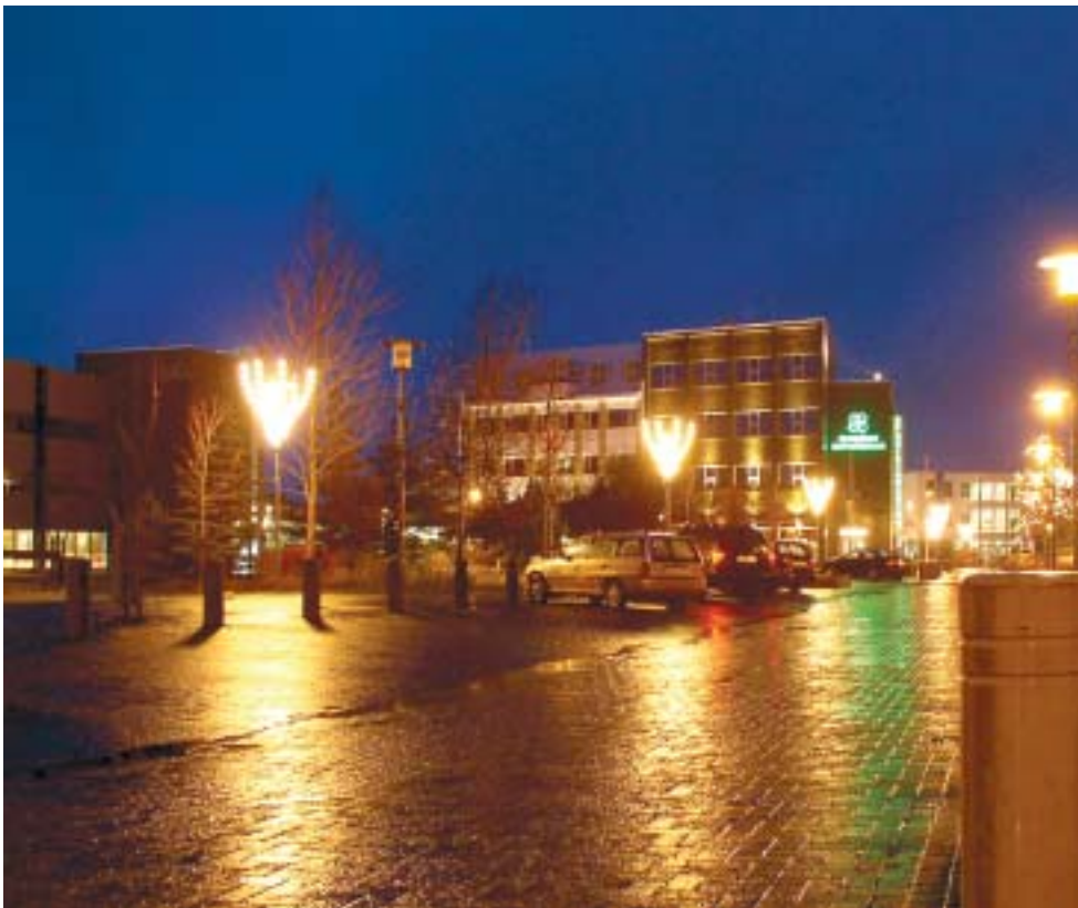
Þó það geti verið fallett við Strandgötuna þá er hún fremur tómleg og mörg stór göt í henni. Miðbæjarnefndin telur rétt að vinna að því að fjölga verslunum og þjónustuaðilum við Strandgötuna áður en hafist verður handa við kostnaðarsama uppfyllingu framan við Fjarðargötu.

standa, þar sem ekki verður séð að útlagðir fjármunir muni skila sér í bæjarsjóð fyrr en seint og um síðir. Miðbæjarnefnd telur mikilvægara að efla miðbæinn með þéttingu byggðar á vannýttum lóðum sem úthluta má án verulegs tilkostnaðar.