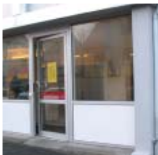
Íslandspóstur Strandgötu 24 Allar almennar póstsendingar

FJARDAR pósturinn www.fjardarposturinn.is Allar auglýsingar líka í netútgáfunni!