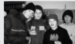
Þessum ungu mönnum úr Lækjarskóla leist vel á væntanlegt kaffi- og menningarhús

Nú hafa yfir 200 manns gerst stofnfélagar í Regnbogabörnum. Skráning stendur enn yfir í síma 575 1550 og á vefsetri félagsins regnbogaborn.is.