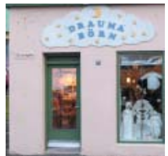
Draumabörn Strandgötu 17 Barnaföt í úrvali