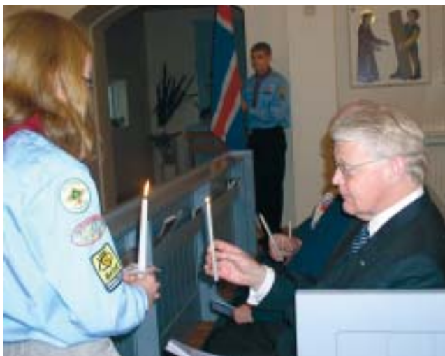
Forseti Íslands var viðstaddur athöfnina og fékk logann frá ungum skáta.

sunnudag tóku ungir skátar við ljósinu á ný og dreifðu til kirkjugesta og einnig var tendrað á olíuluktum til að dreifa ljósinu um landið.