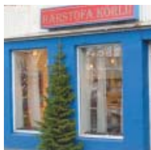
Hárstofa Körlu Strandgötu 19 Setur hárið í sparibúning