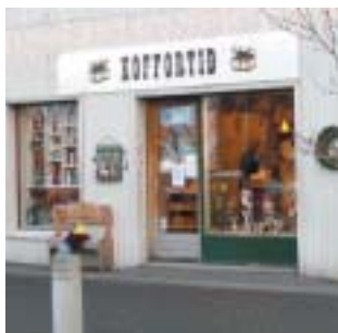
Koffortíð Strandgötu 21 Föndurvörur í miklu úrvali