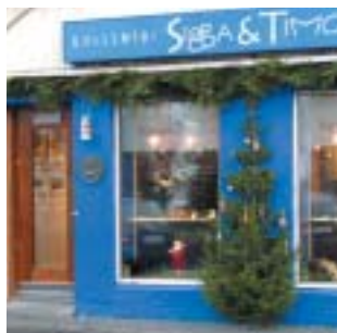
Sigga & Timo Strandgötu 19 Sersmíðaðir skartgripir