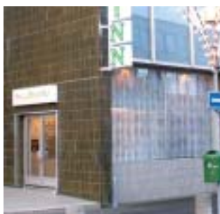
Sparisjóður Hafnarfjarðar Hefur þjónað bæjarbúum í 100 ár