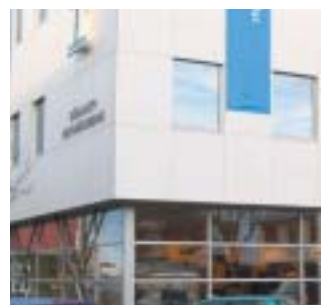
Bókasafn Hafnarfjarðar Þar færðu lánaðar bækur og tónlist