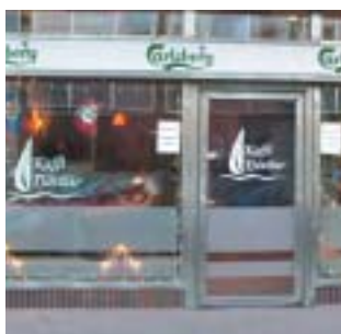
Kaffi Fjörður/Leikhúsið Strandg. 11 Háspennu spilasalur og kaffihús