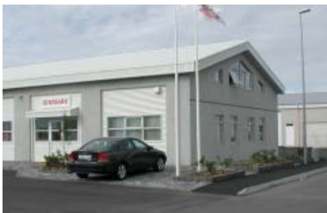
Það þarf ekki mikið til að gera umhverfi iðnaðarhúsa snyrtileg eins og hér hjá Iðnmarki að Gjótuhrauni 5