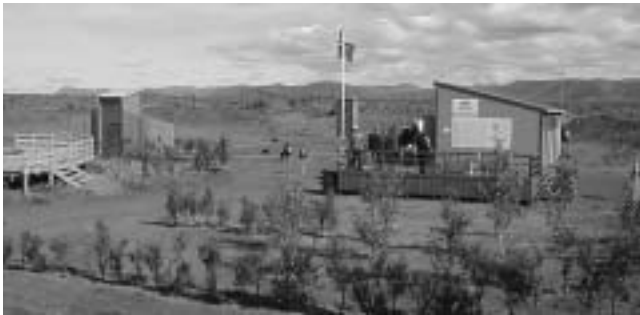
Svæði félagsins er eins og vin í eyðimörk, snyrtilegt og fínt.