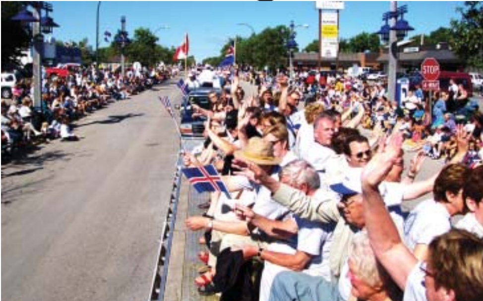
Gríðarlega löng lest alls kyns farartækja fór um götur Gimli og alls staðar var fólk við vegarbrúnina. Rótarýfélögarnir gáfu börnum íslenska fána og sungu íslenska söngva hástöfum.

Nú eru liðin 127 ár síðan um 200 manns tóku land á tanga sem heitir Willow Island, rétt þar sem Gimli stendur nú við Winnipegvatn. Þetta fólk hafði upplifað miklar hrakningar en vont veður varð til þess að prammar sem fólk var á voru skornir aftan úr dráttarbatnum sem átti í miklu basli og rak prammana að landi. Þau upplifðu einn kaldasta og lengsta vetur við Winnipegvatn í langan tíma og tjöld og kofar var það eina sem þau höfðu. Barn fæddist daginn sem fólkíð kom