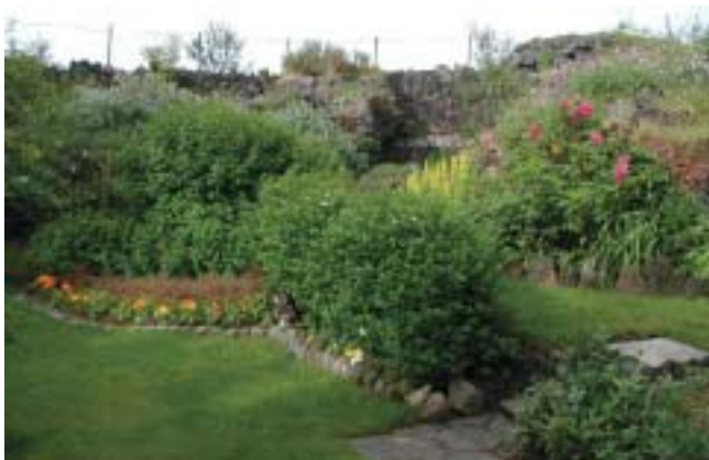
Garður Bjargar Sigurðardóttur að Norðurbraut 15

Þjónustumiðstöð Hafnarfjarðar - Viðurkenning fyrir