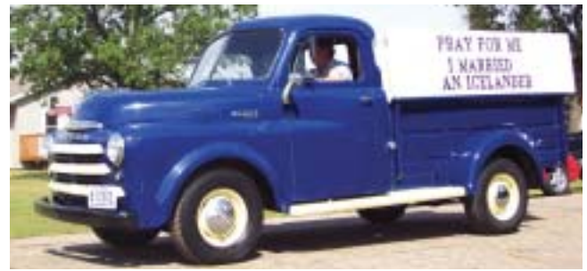
Þessi Mountain-búi hafði húmorinn í lagi þó svo eiginkona hans hafi ekki verið sérstaklega hrifin af framtaki eiginmanns síns.

sem alla tíð hefur verið mikilvæg við Winnipegvatn sem er geysilega stórt vatn. Fleiri komu í þetta Nýja Ísland eða New Iceland eins og það er kallast og það sem sérstakt við þetta fólk er að það vildi verða Kanadískir borgar og gegna skyldum sem slíkir en á sama tíma viðhalda sinni menningu og siðum og bera áfram til sinna afkomenda. Íslendingadagurinn í Gimli var haldinn í síðustu viku í 113. skipti og talið er að um 50 þúsund manns hafi verið í bænum