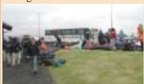
Hluti Hafnafirðinganna ásamt bandarískum og dönskum skátum halda af stað sl. þriðjudag.