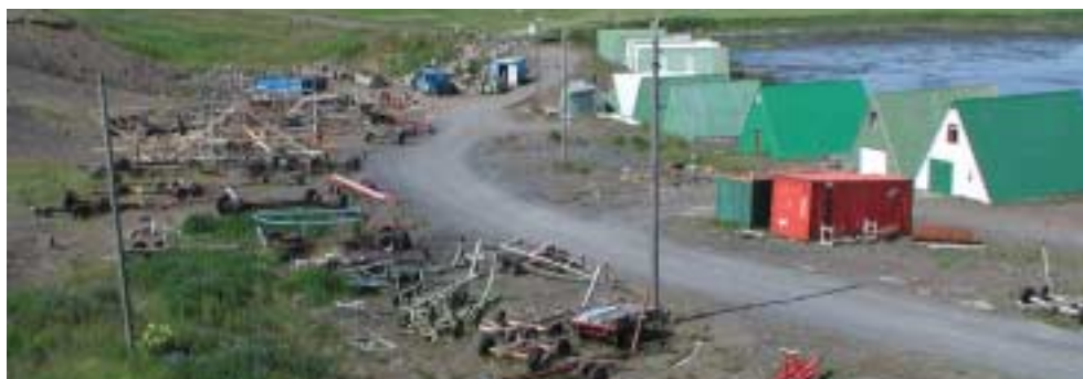
Ljóm.: Guðni Gíslason